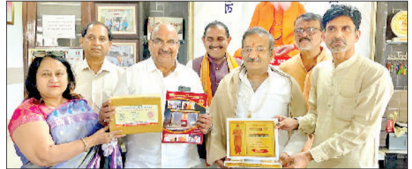
फतेहाबाद। मुख्यमंत्री के राजनीतिक सचिव तरुण भंडारी को सम्मानित करते आश्रम के मुख्य सेवादार।

मुख्यमंत्री के राजनीतिक सचिव तरुण भंडारी ने फतेहाबाद में हिसार-सिरसा बाईपास स्थित सदगुरु कृपा अपना घर आश्रम का दौरा किया। शहीदी दिवस के पावन अवसर पर आयोजित कार्यक्रम में उन्होंने समाज के अंतिम पायदान पर खड़े निराश्रित और मंदबुद्धि लोगों के साथ समय बिताया और आश्रम की व्यवस्थाओं का जायजा लिया। आश्रम पहुंचने पर तरुण भंडारी ने शहीदी दिवस के उपलक्ष्य में आश्रम में रह रहे मंदबुद्धि पुरुषों और महिलाओं को फल वितरित किए। इस दौरान उन्होंने उनसे आत्मीय बातचीत की और उनका कुशलक्षेम जाना। इसके पश्चात, वह आश्रम परिसर में संचालित गौशाला पहुंचे, जहाँ उन्होंने गौमाता को हरा चारा और गुड़ खिलाकर सेवा की।