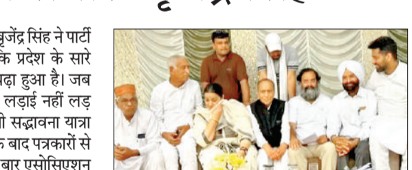
सिरसा। बार एसोसिएशन में पत्रकारों से बातचीत करते पूर्व सांसद बृजेंद्र सिंह।