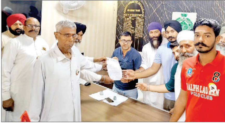
फतेहाबाद। मार्केट कमेटी सचिव को ज्ञापन सौंपते पगड़ी संधाल जट्टा किसान संघर्ष समिति के पदाधिकारी।

किसानों ने बताया कि सरकार ने इस बार मंडी में फसल लाने वाले ट्रैक्टर-ट्रॉली पर नंबर अनिवार्य करने और किसानों की हाजिरी के लिए बायोमेट्रिक जैसी कड़ी शर्त लागू कर दी है। उन्होंने कहा कि ग्रामीण इलाकों में इंटरनेट और सर्वर