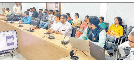
सिरसा। प्रशिक्षण शिविर में भाग लेते कर्मचारी।