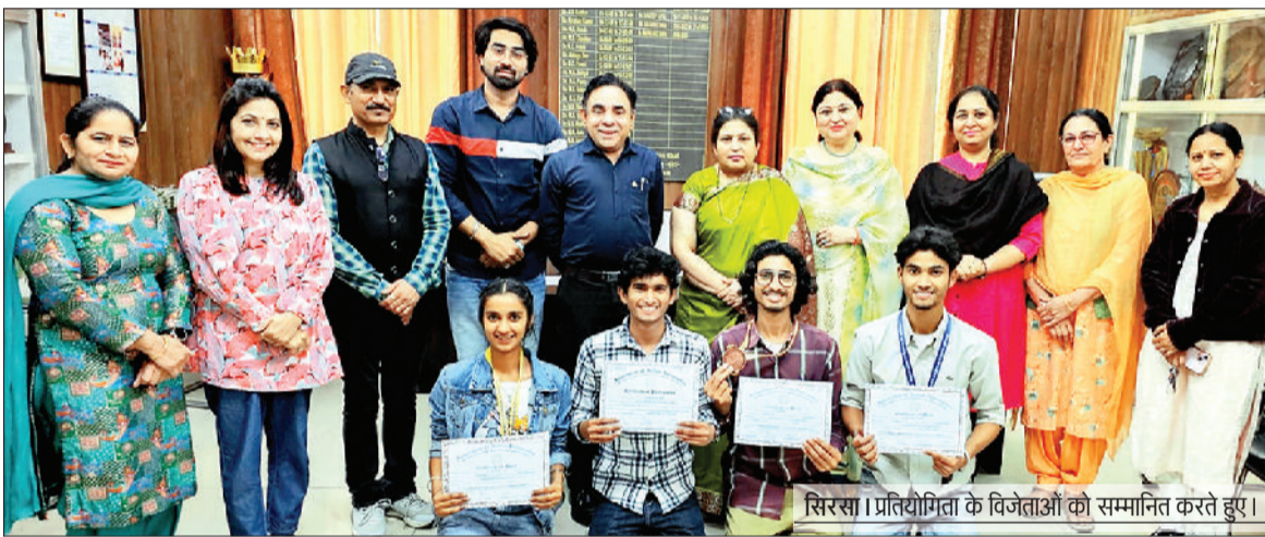
सिरसा। प्रतियोगिता के विजेताओं को सम्मानित करते हुए।